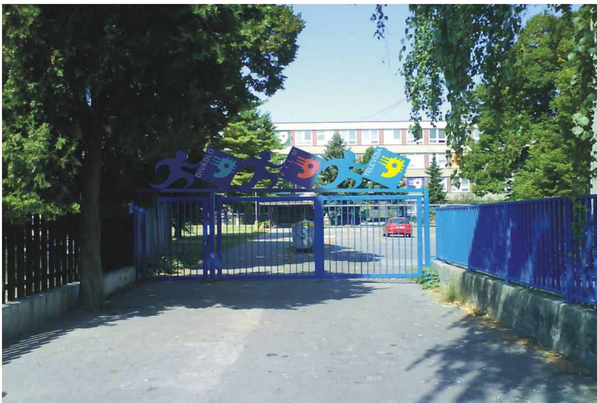
Budova školy – Sklenárova 7 (súpisné číslo.1354)