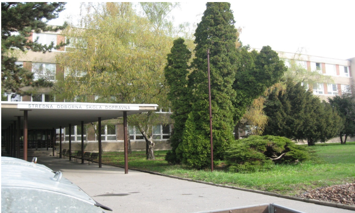
Budova školy – Sklenárova 9 (súpisné číslo 1355)